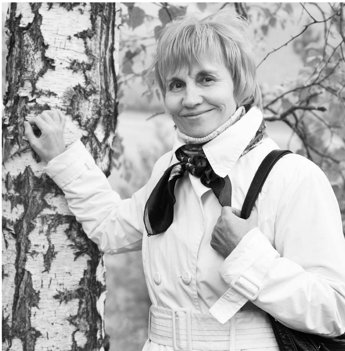
Осень для учителя — это воистину золотая пора, начало творческой жизни

Врач, инженер, продавец, полицейский — люди этих профессий важны для обще- ства, без них трудно предст- авить нашу жизнь. Но учитель! Мне кажется, люди этой про- фессии — основа основ, они закладывают фундамент и че- ловека, и даже государства. Представители этой профес- сии всегда ценились и уважа- лись в обществе. Питаю на- дежду — и пока ещё ценятся.