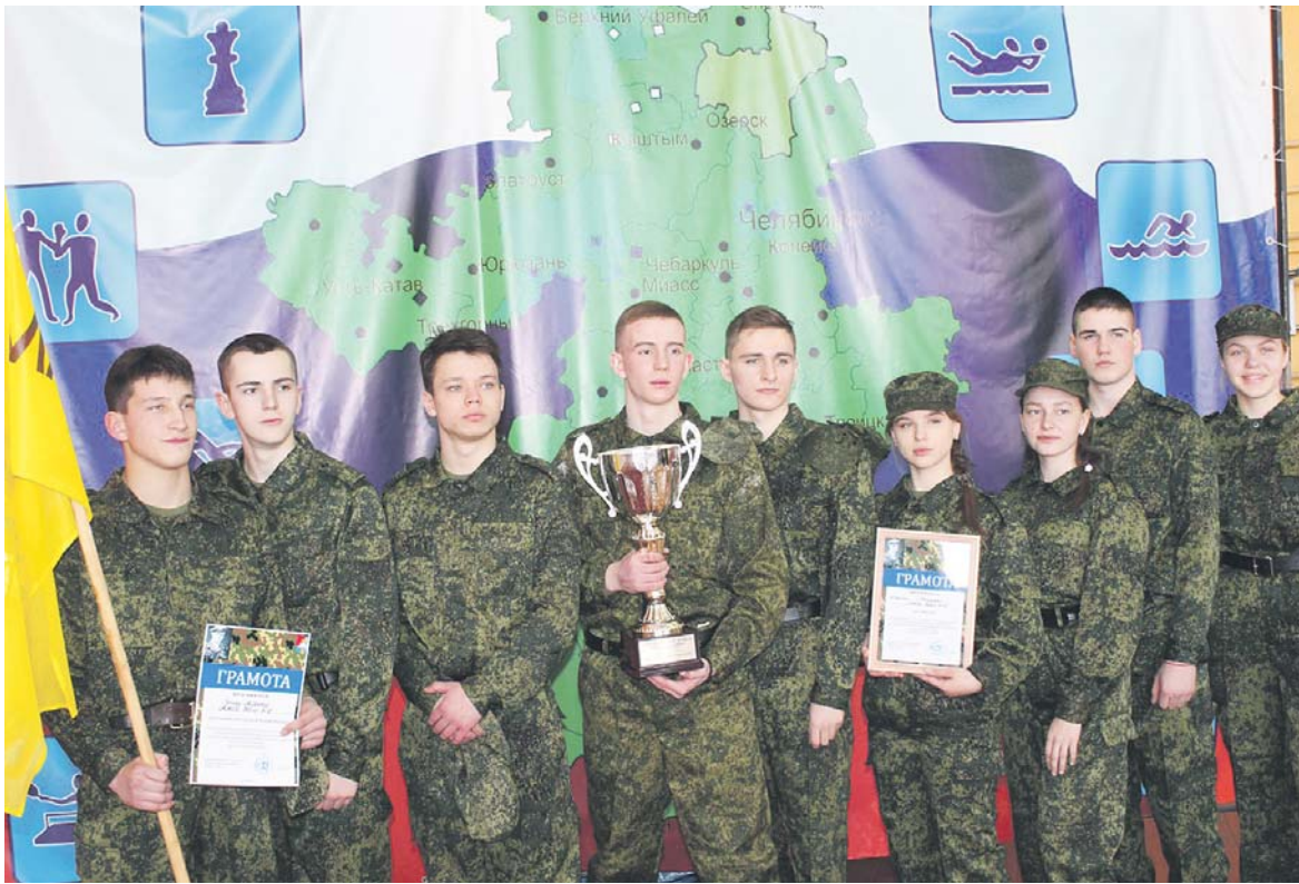
Победители соревнований — команда «Феникс»