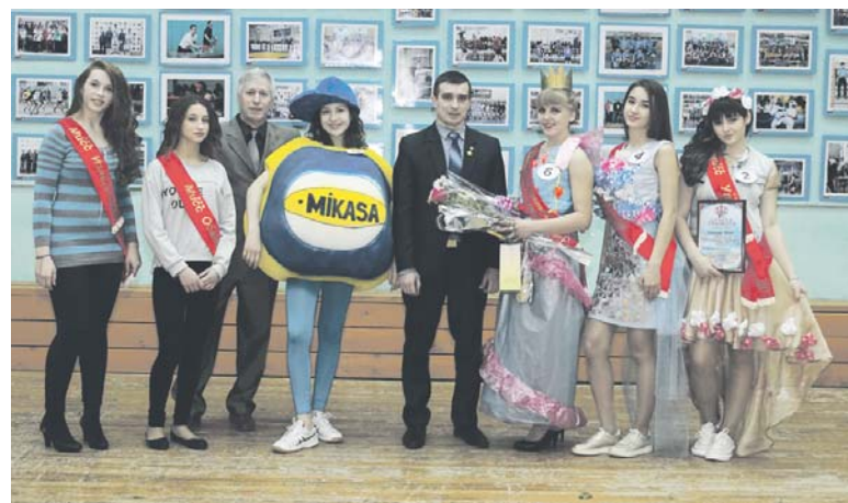
Участницы-спортсменки первого замечательного конкурса