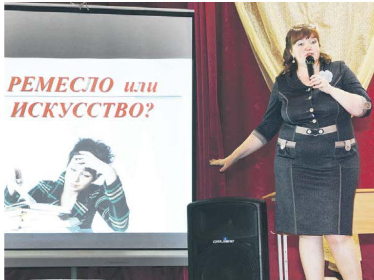
«Во всём мне хочется дойти до самой сути»

— Моя профессия требует самообразования. Здесь нельзя стоять на месте, нужно много читать. Может, это и моё внутреннее стремление, но для профессии учителя надо много учиться. Здесь очень большие эмоциональные затраты, мы очень переживаем за своих учеников. И научить учеников, которые не хотят учиться, — тоже сложно.