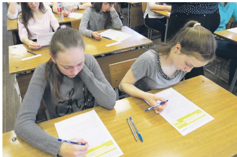
Здесь вы можете не только проверить свои знания русского языка, но и приобщиться к литературе