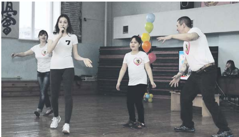
«Визитная карточка». Рэп от семьи Зиннатулиных