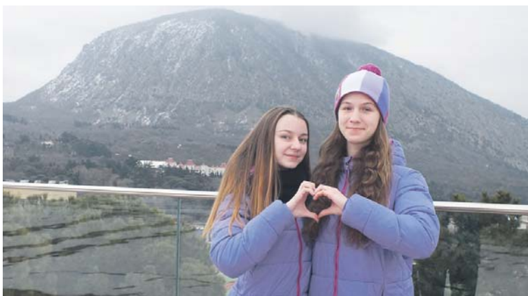
Гору Аю-Даг и подруг со Златоуста и Москвы я забрала с собой на флэшке

На протяжении смены были определённые препятствия, кото-