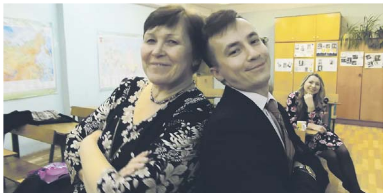
Спина к спине — надёжный тыл