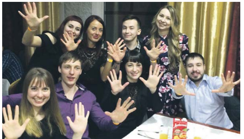
10 лет прошло, а мы всё те же дети!

vk.com Усть-Катавская молодёжная газета «БУМ»