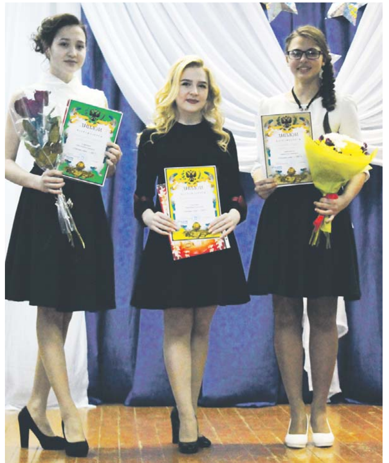
У каждой участницы — своя победа

— Очень тревожилась перед выступлением, дрожь в голосе была слышна, но зрители понимали меня и старались всячески поддерживать. Именно это дало мне уверенность в своём выступлении. Огромную роль во всех этапах конкурса сыграла и моя группа поддержки — благо-