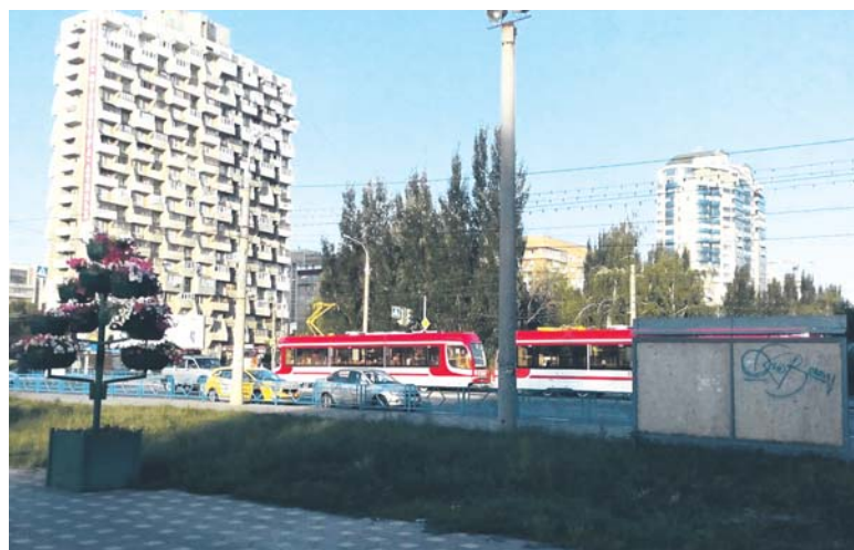
По Самаре ходят наши красавцы-трамваи

кабинки выстраивалась очередь, как от центра до МКР. Здесь было абсолютно всё, можно было приехать налегке: такой ассорти,