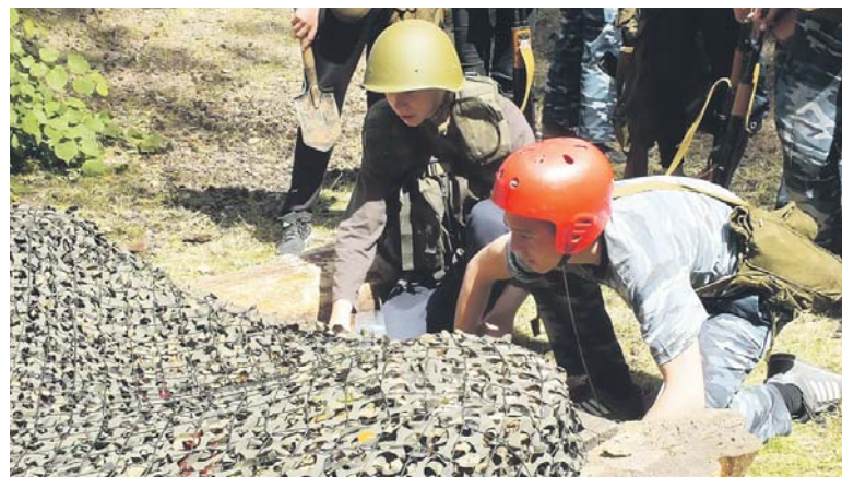
Ребята готовятся проходить через узкий лаз

Елизавета ПЕТУХОВА.