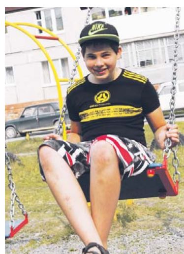
Компьютер останется, а лето нужно использовать по полной