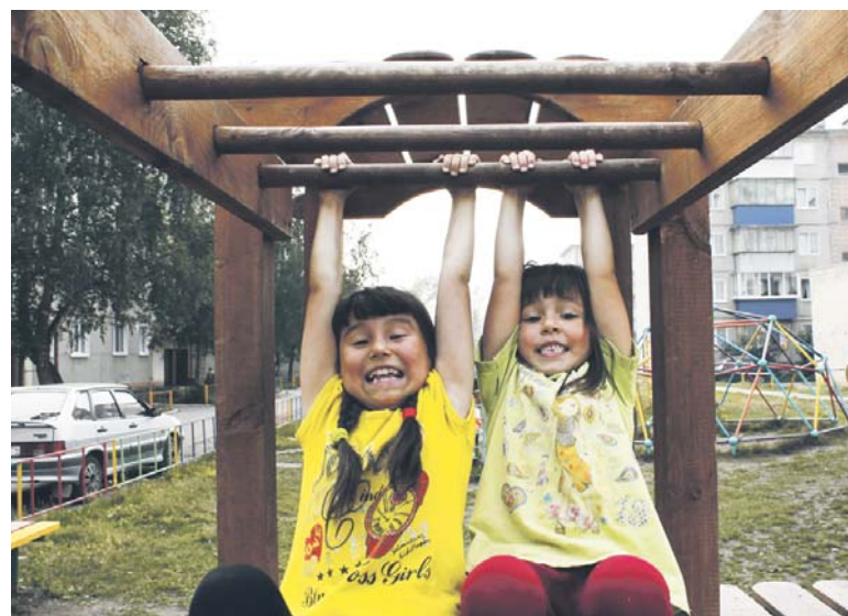
Не жалейте время для друзей