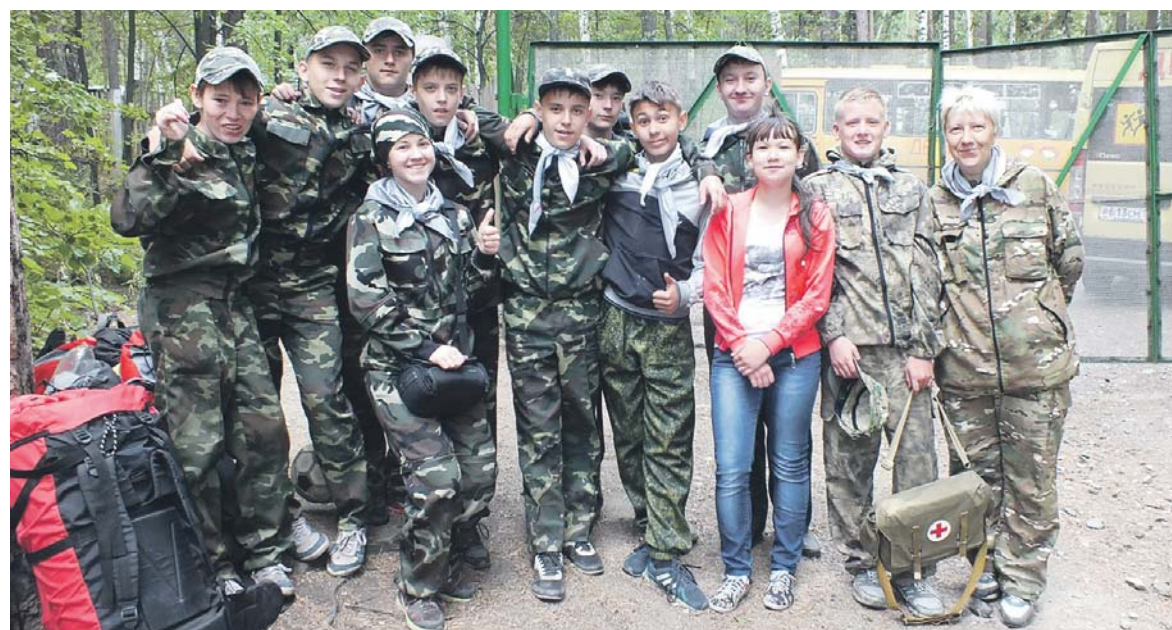
Команда «Экстремалы» готова к соревнованиям

Больше всего запомнилась полоса препятствий. Это не трасса с туристическими элементами, а целая имитация военных условий.