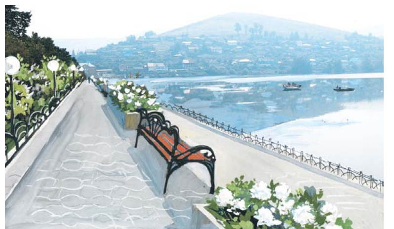
Замечательное место для прогулок горожан