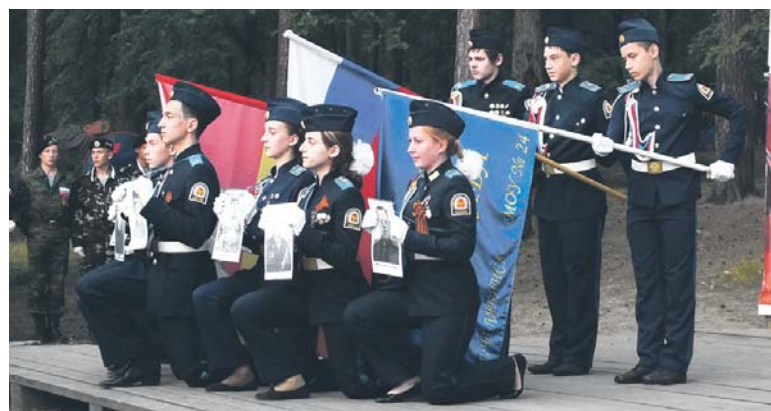
Команда «Патриот» школы № 24 г. Челябинска представляет свою визитку