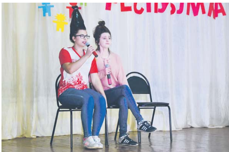
Неожиданными причёсками девчонки подняли настроение в зале

Екатерина АЛЕКСЕЕНКО