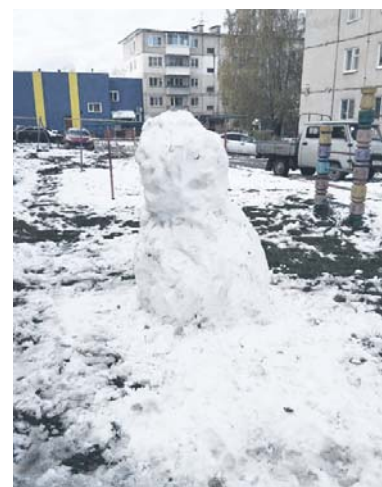
...Интересно, какое чувство помогает сотворить обратное