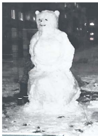
Будучи на позитиве, мы слепили снеговика...