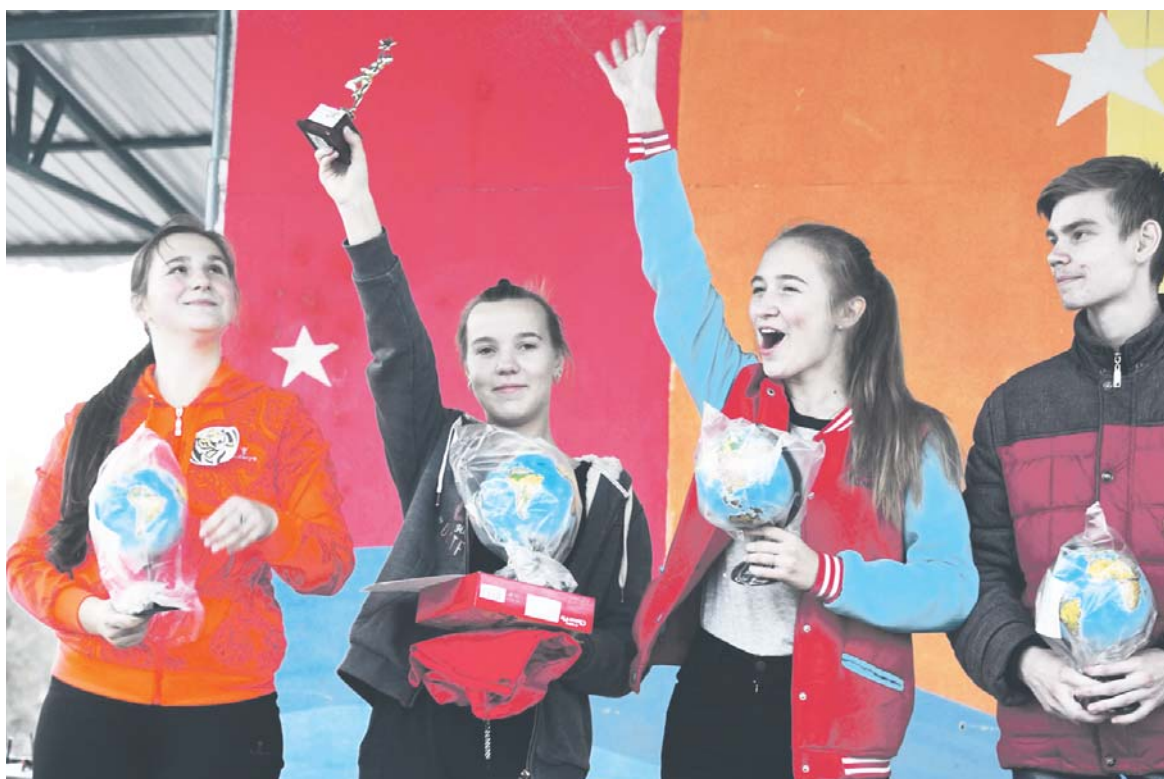
Восемь ключей собраны раньше всех. Итог — кубок победителя в руках

Двенадцатого октября возле ЦДТ прошёл Городской молодёжный экологический квест «Эко-Бум». Квест — интерактивная игра-головоломка на время по запланированному маршруту. Суть этого квеста состоит в том, чтобы привлечь внимание на экологию города, уважительнее относиться к природе. Кураторы рассказали про экологию, что мы не должны загрязнять нашу землю, ведь благодаря ей мы живём на нашей прекрасной планете.