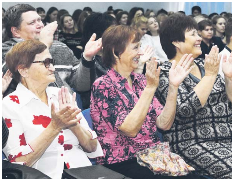
Счастливые учителя принимают поздравления