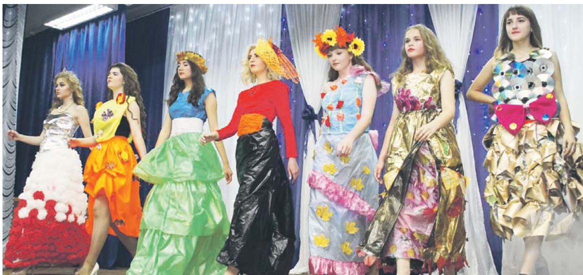
Девчонки демонстрируют осенние костюмы, созданные своими руками

Фото из архива команды. Коллаж Марины ТРИШИНОЙ.