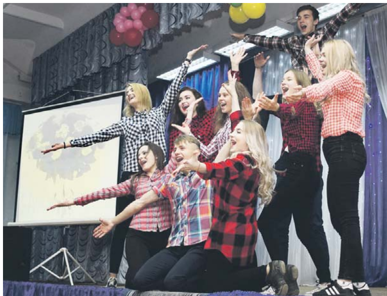
Зажигательный 11-й класс дарит творческое выступление любимым педагогам