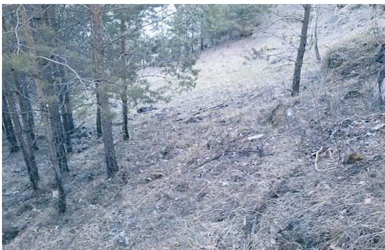
Ксения Самойлова: «2014 год. 8 человек. Это первый опыт. Почистили Марьин Утес, Склон у села Орловка. Три раза полностью забивали мусором прицеп и багажники машин».